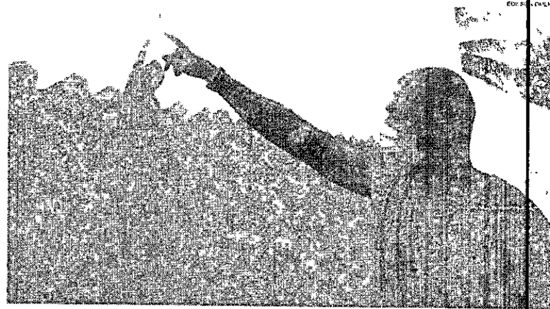
Processo de danos em imóveis tem se intensificado desde o início do ano, segundo proprietários que vivem no local.

A Defesa Civil de Maceió investiga o aparecimento de rachaduras em imóveis no bairro do Farol. De acordo com moradores da Rua Tenente Antônio Oliveira, as fissuras começaram ainda em 2018, mas que não chegaram a fazer associação ao afundamento que atingiu Pinheiro, Bonifácio, Marango e Bom Pastor. Ainda segundo moradores, não houve nenhuma investigação oficial em 2018, mas que não chegaram a fazer associação ao afundamento que atingiu Pinheiro, Bonifácio, Marango e Bom Pastor. Ainda segundo moradores, não houve nenhuma investigação oficial em 2018, mas que não chegaram a fazer associação ao afundamento que atingiu Pinheiro, Bonifácio, Marango e Bom Pastor.